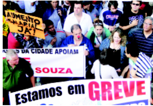
Manifestação na capital, em 20/5/2011

trativos) e a 1º de junho (no caso da progressão para docentes e auxiliares docentes).